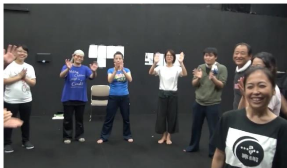
劇団銅鑼座員によるワークショップの様子